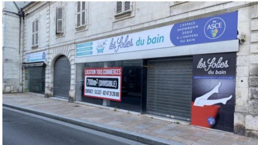
Le local était vide depuis mars 2021 et la fermeture du magasin Les Folles du bain.