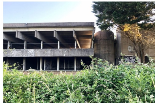
Dans l'attente de l'écriture définitive du projet de tiers-lieu durable, l'équipe de L'Escalier Combleux revient cette année avec son Tiers-Lieu éphémère.

Un week-end de fête est prévu sur le site de la friche IBM, à Combleux. Mariniers, guinguette, concerts seront de la partie... Avec Alex Lutz et Alice Tagliani !