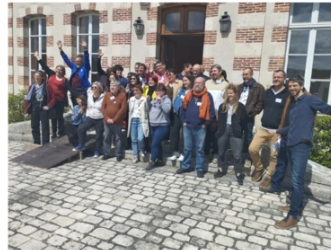
Les participants ont exprimé tout leur enthousiasme à l'idée de travailler ensemble et de visiter le château de Cepoy.