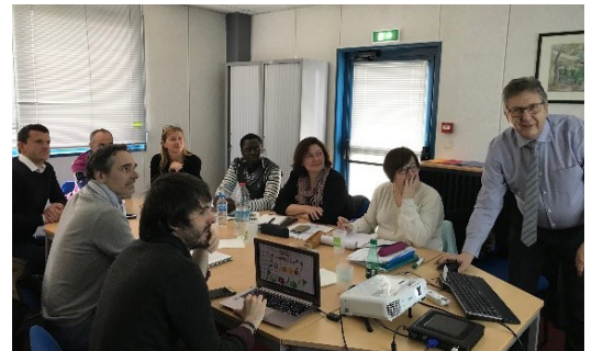
Stage CERPEP à la MGEN 45

La CRESS a également pu participer à la journée de l'engagement des jeunes en région organisée par le CRIJ, le CRAJEP et le CRJ à l'initiative de la Région Centre-Val de Loire, en animant un stand de présentation de ses missions et de l'ESS et en participant à l'émission de Radio 100% lycéens en direct de l'événement.