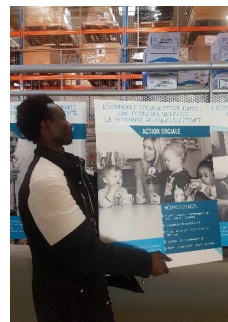
Exposition sur les métiers de l'ESS au Lycée Mermoz de Bourges