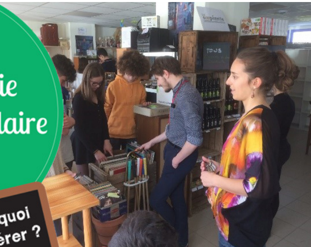
Visite du 6-10 Pôle ESS avec les élus du CAVL

Du 25 au 30 mars, une dizaine de milliers d'élèves partout en France ont pu découvrir l'économie sociale ou valoriser leurs projets menés dans le cadre de la «Semaine de l'Économie Sociale et Solidaire à l'École».