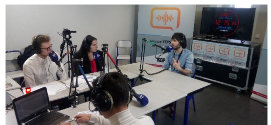
Participation à la journée de l'engagement le 30/03